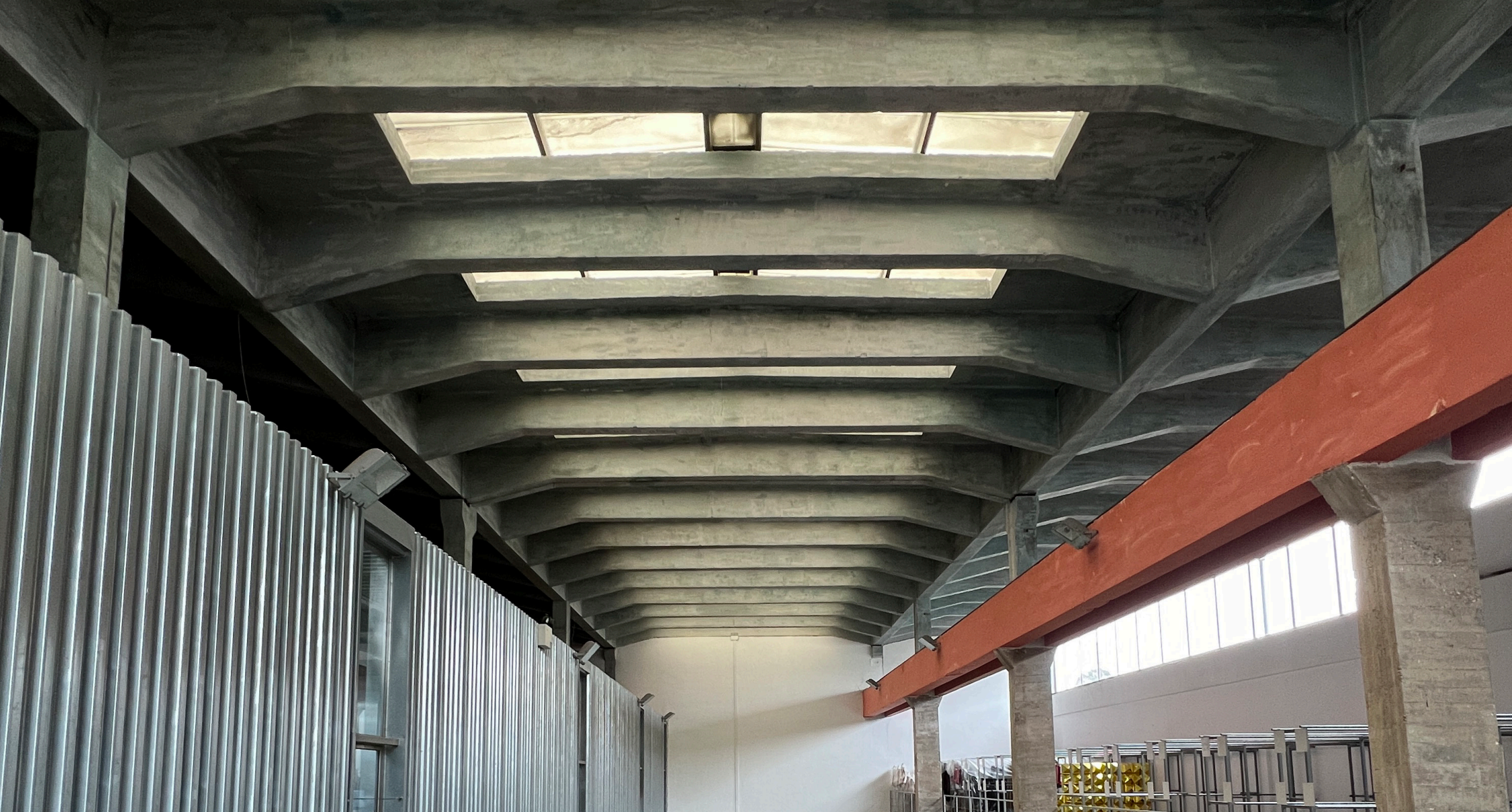
LA NAVE PRINCIPAL